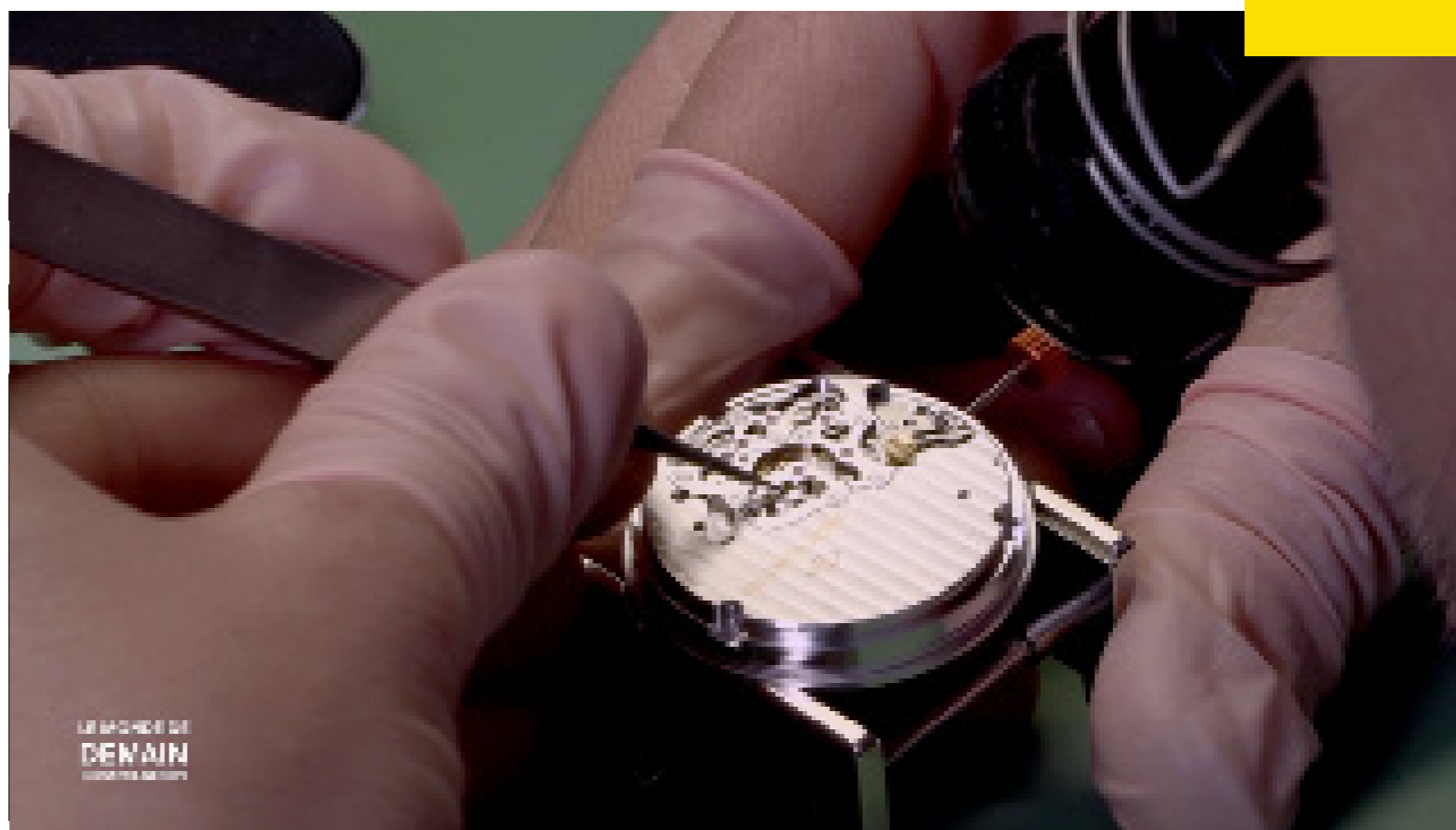
Teaser sur la sous-traitance horlogère diffusé sur les divers canaux d'Industrie-Genève et de ses partenaires, juin 2021

Il est envisagé de continuer de renforcer l'image de Genève comme place industrielle résiliente et innovante, notamment par la poursuite de tel type de coopération