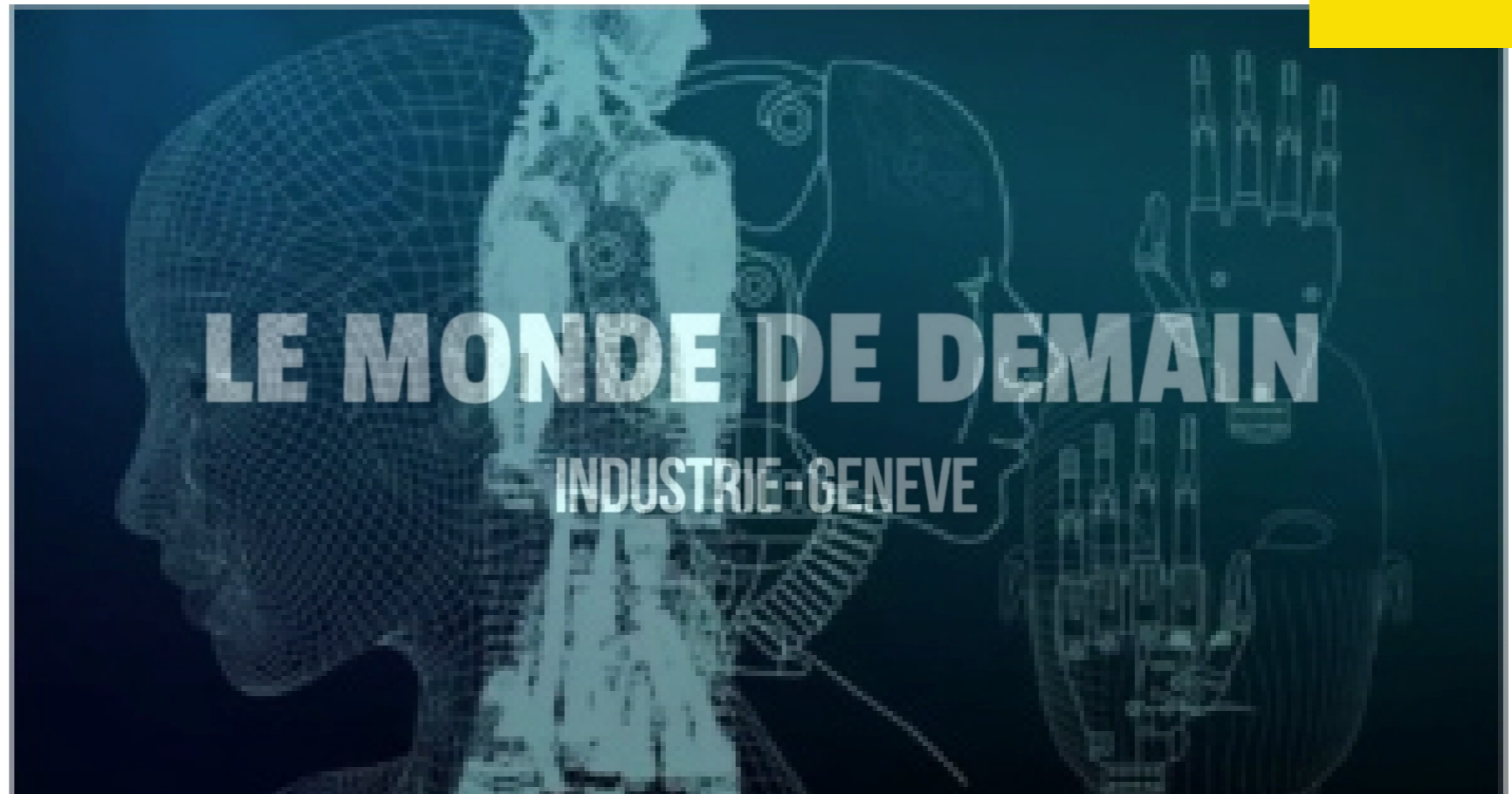
Générique de l'émission #Le Monde de Demain sur Léman Bleu